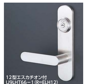
12型エスカチオン付 U9LHT66-1 (R=ELH12)