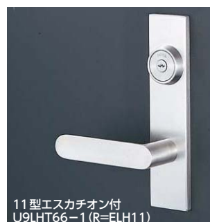
11型エスカチオン付 U9LHT66-1 (R=ELH11)