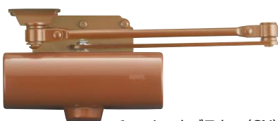
チョコレートブラウン (CN)