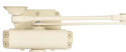
ミルキーホワイト (MW)