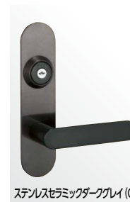
ステンレスセラミックダークグレイ (CD)