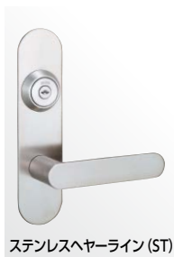
ステンレスヘヤーライン (ST)