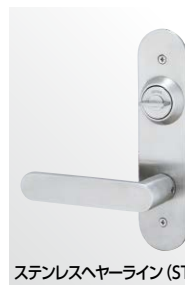
ステンレスヘヤーライン (ST)