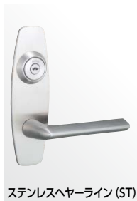
ステンレスヘヤーライン (ST)

U9LA52-1型 (R=ELA16) :ST, SB, CB, CD仕上、U9LA74-1型 (R=ELA16) :BS, YB仕上