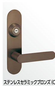
ステンレスセラミックブロンズ (CB)