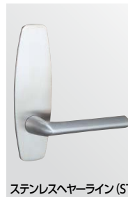
ステンレスヘヤーライン (ST)