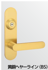
黄銅ヘヤーライン (BS)