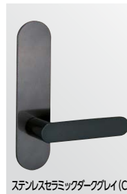
ステンレスセラミックダークグレイ (CD)