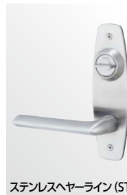
ステンレスヘヤーライン (ST)