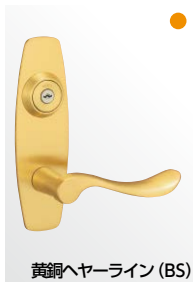
黄銅ヘヤーライン (BS)