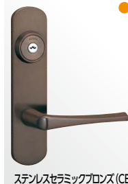
ステンレスセラミックグロス (CB)