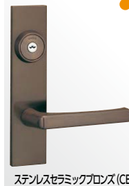
ステンレスセラミックグロス (CB)