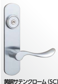
黄銅サテックローム (SC)