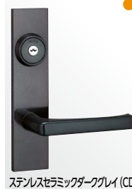
ステンレスセラミックダークグレイ (CD)