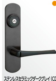
ステンレスセラミックダークグレイ (CD)