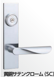
黄銅サテックローム (SC)