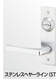
ステンレスヘアライン (ST)