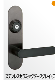
ステンレスセラミックダークグレイ (CD)