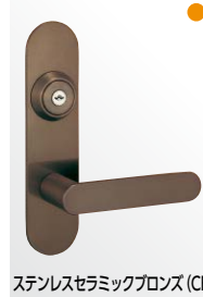
ステンレスセラミックブロンズ (CB)