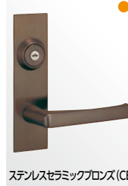
ステンレスセラミックブロンズ (CB)