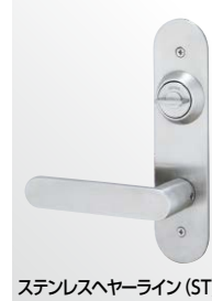
ステンレスヘアライン (ST)