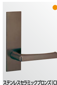
ステンレスセラミックブロンズ (CB)