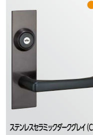
ステンレスセラミックダークグレイ (CD)