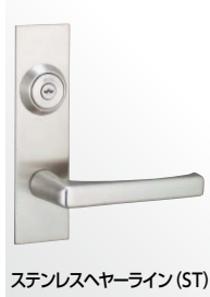
ステンレスヘアライン (ST)