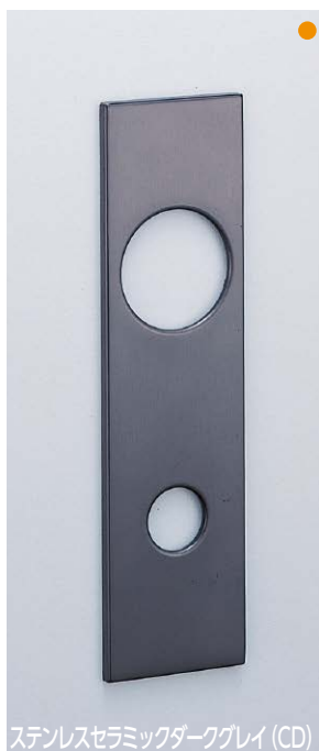
ステンレスセラミックダークグレイ (CD)

(注) この型式はエスカション単体を示します。 シリンダー、レバーハンドルは含まれませんのでご注意ください。