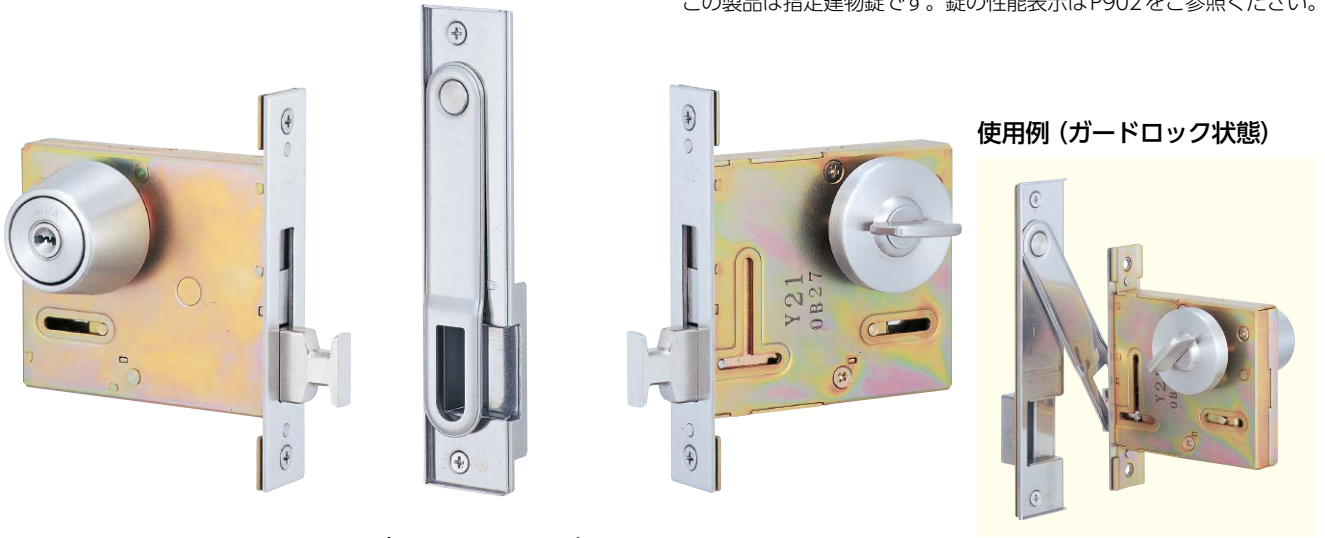
写真はPRGAA-1型 (左勝手を示す)