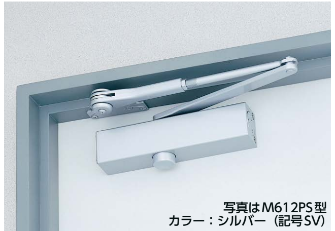
写真はM612PS型 カラー：シルバー（記号SV）