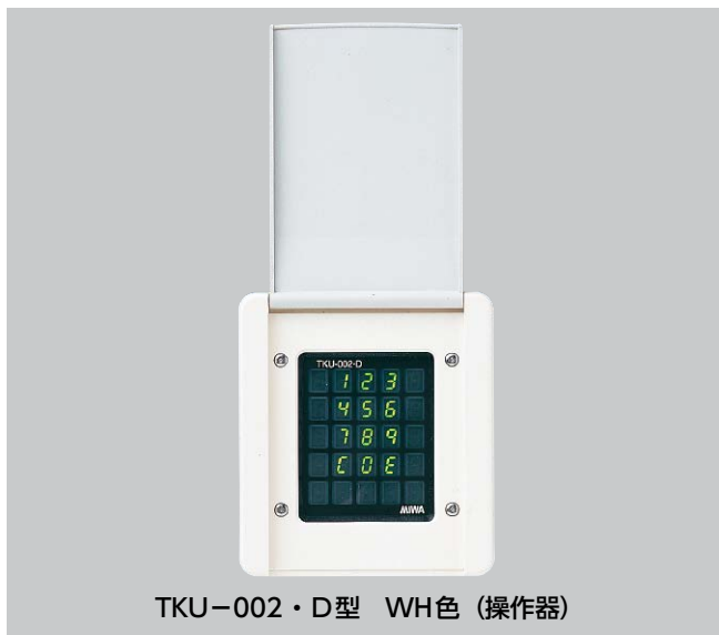
TKU-002・D型 WH色 (操作器)