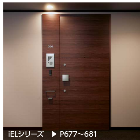
iELシリーズ ▶ P677～681

また、スマートフォンで遠隔所から扉の状態確認や電気錠の施錠ができるwiremoシステムも導入可能です。詳細はP686を参照ください。