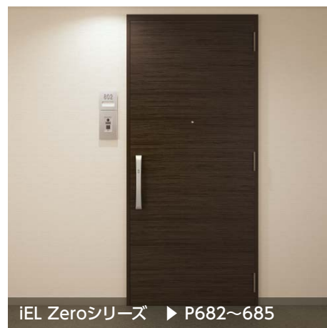
iEL Zeroシリーズ ▶ P682～685