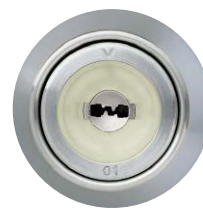
キーウェイ形状 (スリバチ蓄光仕上)

注) LED照明をお使いの場合や蓄光時間が少ない場合、周囲が明るい場合等、環境により視認できないこともあります。