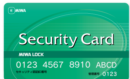
セキュリティカード (製品に同梱)